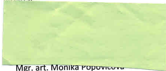
Mgr. art. Monika Popovicová zhotoviteľ