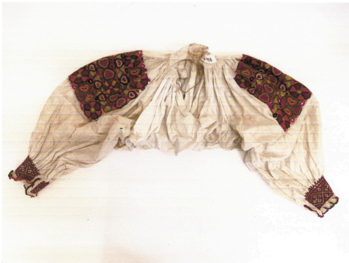
Príloha č. 1 k zmluve č. TM-4/2024 - fotodokumentácia: Rukávce biele s červenou furmou, F-1658, p. č. 200/78